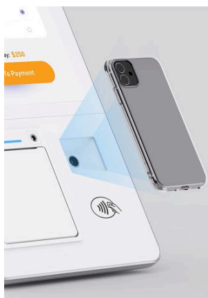
Escáner de QR sin Contacto

Grandes Superficies Tiendas de Convivencia Boutiques Plazas Comerciales Supermercados Ropa Restaurantes Y mucho más