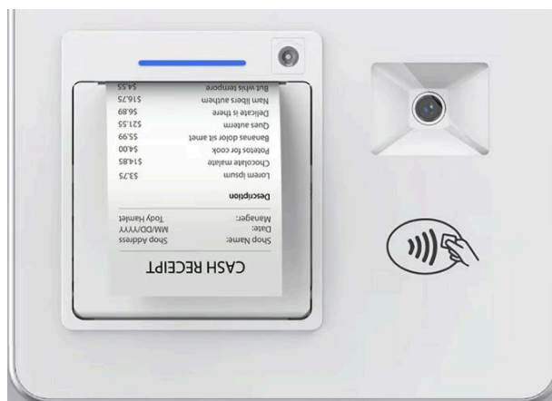
Impresora incluida de 58mm